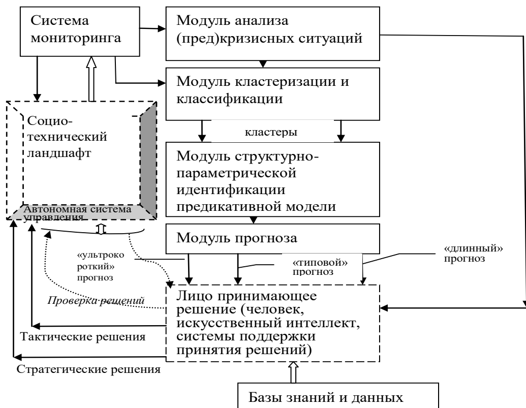
Рисунок 2 Информационно-аналитическая модель анализа предкризисных ситуаций в СТЛ на основе мониторинга при умвельт-анализе.

Для мониторинга цифровых (и иных) умвельтов с целью анализа эволюционирования эволюционных практик предлагается информационно-аналитическая модель, представленная на рисунке 2.